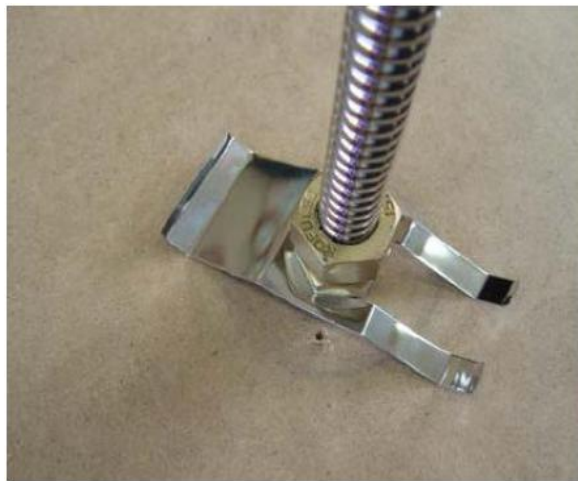
1. Зажим для крепления гибкой подводки (фитинга) в панели подвесного потолка. (Рекомендовано при длине подводки более 40см)