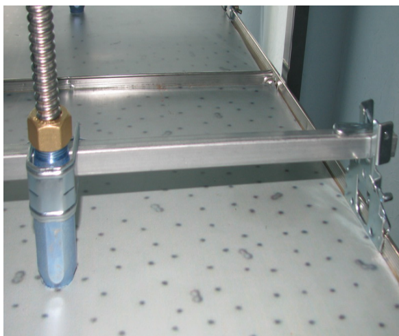
3. Реечное крепление со специальным фитингом для жесткой фиксации подводки на направляющих подвесного потолка, а также в потолке зашитом гипсокартонном. Данная система позволяет регулировать положение спринклера по высоте, а также позволяет осуществлять обслуживание (монтаж/демонтаж спринклера без вскрытия потолка) (Рекомендовано при длине подводки более 80см).